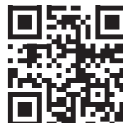
První pomoc – Zásady první pomoci

zdroj: Postup při volání Rychlé zdravotnické pomoci. První pomoc: Zásady první pomoci. Retrieved February 10, 2021, from http://www.prvni-pomoc.com/postup-pri-volani-rychle-zdravotnicke-pomoci